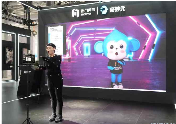
<2023 중국국제서비스무역교역회에서 라이브 솔루션을 시연하는 참가자>